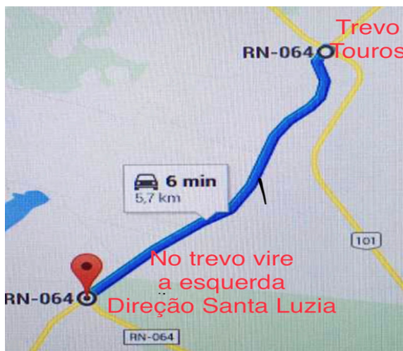
Trevo de Touros ao Trevo RN-064